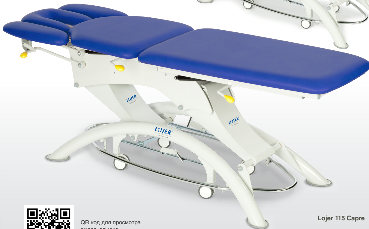
Lojer 115 Capre