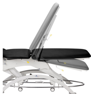
Lojer 110/115 регулируемая ножная секция