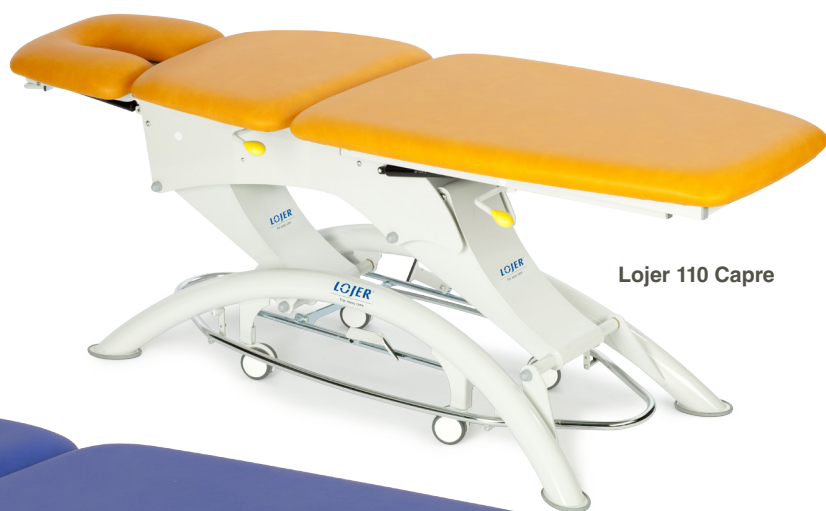
Lojer 110 Capre

Стол series Capre – несомненные лидеры на рынке. Великолепный дизайн и безопасность