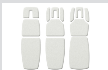
Варианты формы ложа