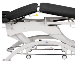
Позиция дренаж (пневмопривод или электропривод)